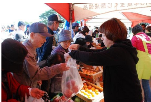
▲ 南種子町ふるさと祭