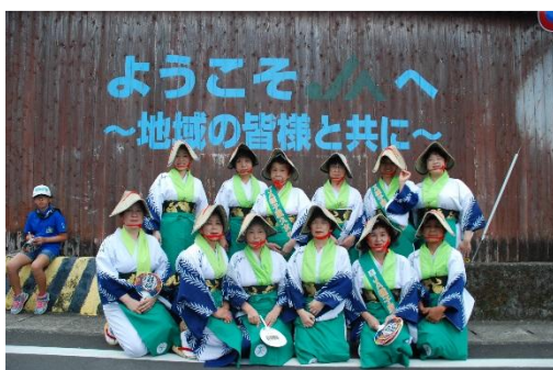
▲ 鉄砲祭 女性部