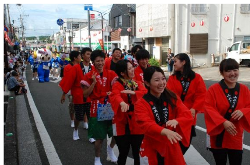
▲ ロケット祭 道中踊り