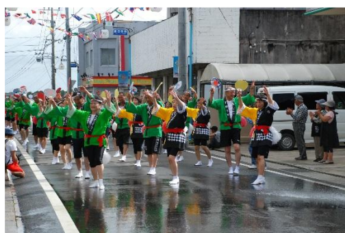
▲ よいらーいき祭 道中踊り