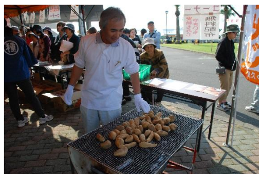
▲ 中種子町農林漁業祭