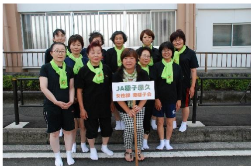
▲ ロケット祭 女性部