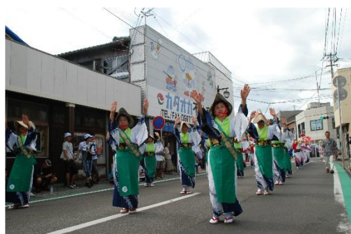
▲ 鉄砲祭 道中踊