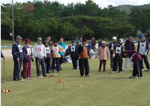
▲皆が注目する同点決勝