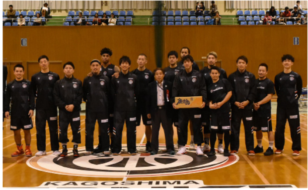
▲鯨島組合長との記念撮影

「11月4日」JA種子屋久は、西之表市市民体育館でプロバスケットボールチーム鹿兒島レブナイズと東京八王子トレインズの試合の開催セレモニーにおいて、農産物を贈呈しました。種子島名産の安納芋（もみじ・紅）それぞれ10kgずつ両チームへ贈呈し、安納芋をいっぱい食べ、これからの試合も頑張ってもらいたいと期待を込め、地元の農産物で応援しました。