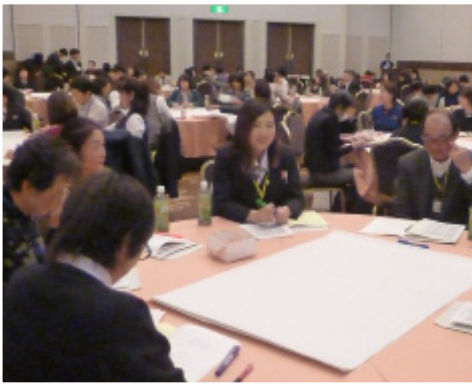
▲グループに分かれての意見交換会

「JAグループ創造的自己改革と助けあい組織・活動のさらなる発展のために」と題した講演や、事例発表・グループに分かれての意見交換会が行われ、各地区との交流も図られました。