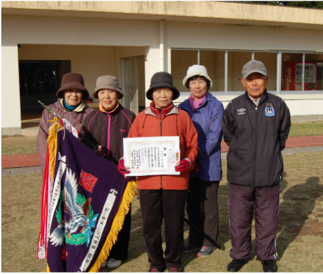
▲優勝したつばさチーム