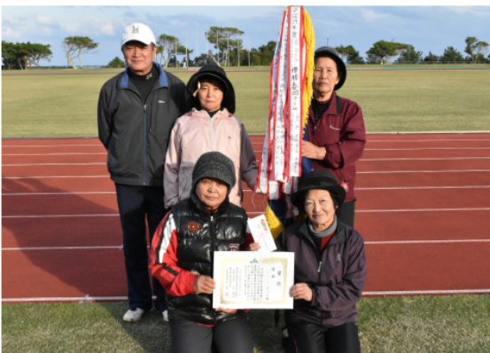
▲優勝した横町2チーム