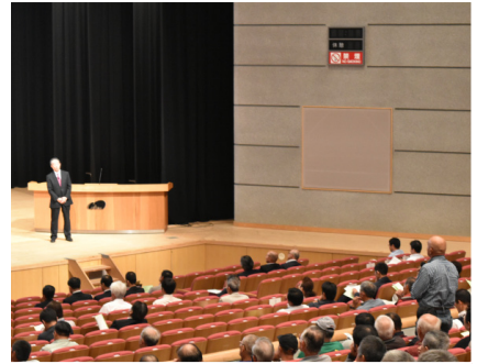
▲意見・要望が多数ありました