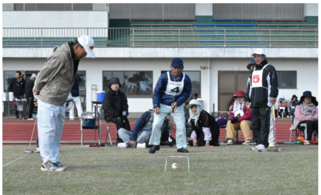
▲皆が見つめる第1ゲート