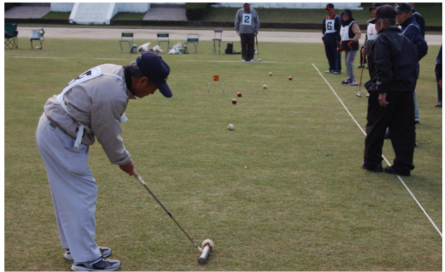
▲チャンス到来・どれかにあたるはず