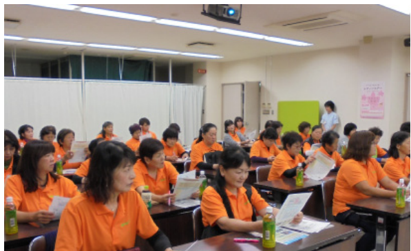
【 厚生連健康管理センター 】