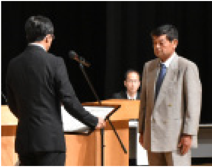
▲受賞した本村生産組合

出席者全員で、種子島の生産現場の問題点や将来に向けた課題を再確認し、さとうきびの振興発展に向けた取り組み強化を確認しました。