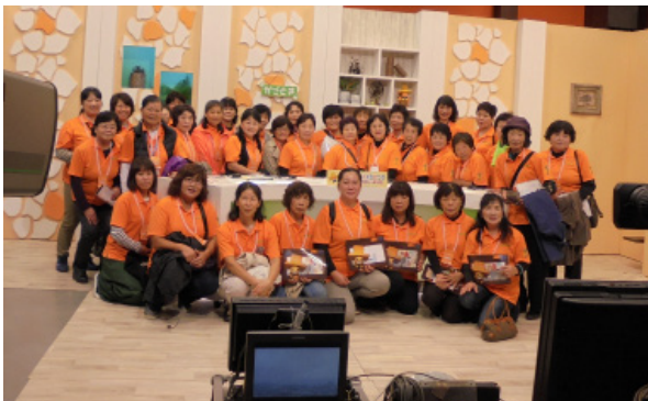
【 KKB 鹿児島放送 】

これからの活動の参考にする為、今回は、KKB 鹿児島放送や厚生連健康管理センターなどで研修を行いました。