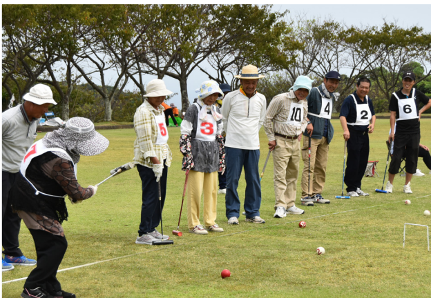
▲JA役職員も参加しました

ゲートボールを通じ、団体・組織の枠を超えた交流が行われ、老いも若きも一体となり、会場は笑い声で包まれていました。