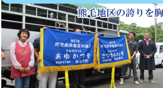
熊毛地区の誇りを胸に県共進会に出発!!