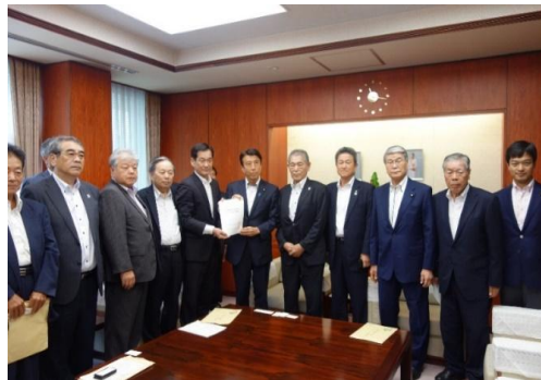
（7月24日 齋藤健農林水産大臣への要請）