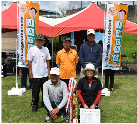
▲優勝した上野Bチーム