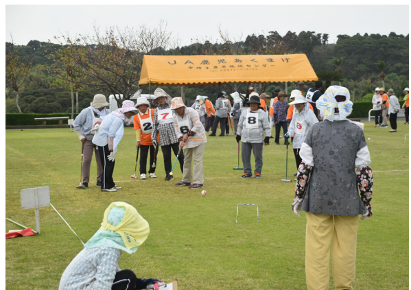
▲優勝した春田OBチーム