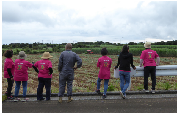
▲サトウキビ刈り倒し機実演の様子