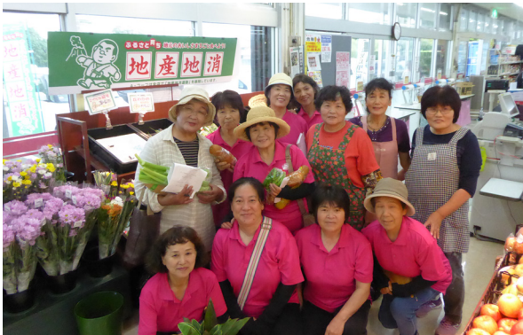
▲直売コーナーの視察

Aコープでは、「まん菜畑」の方から出荷までの流れの説明や売り場の案内を受け、『安心・安全な農産物』に対する意識の高さを参加者一同、再確認しました。