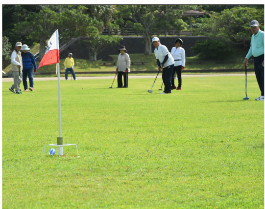
▲ナイスショット・ホールインワンが多くレベルの高い大会でした。