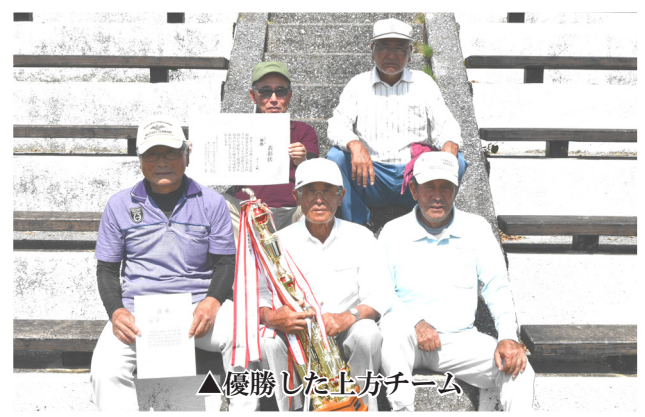
▲優勝した上方チーム