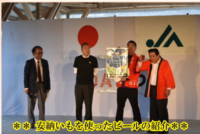
※安納いもを使ったビールの紹介※

会場内では、焼肉の無料試食や肉・野菜・果物・花などを販売。また、当日は安納いもを使ったビールの無料試飲もあり、フルーティーな珍しいビールの味を堪能していました。イベント開始前から長蛇の列ができるなど多くの来場客で賑わいました。