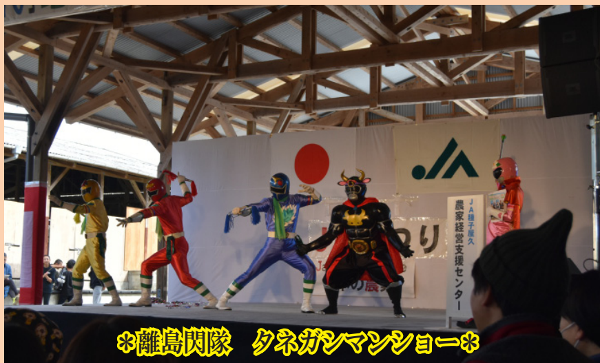
※離島閃隊 タネガシマンショー※