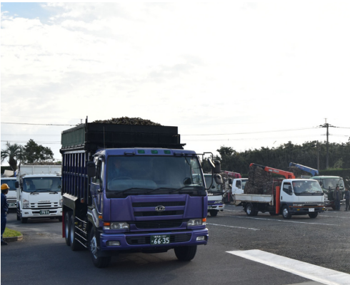
▲サトウキビを積み込んだトラックが次々と工場内に入っていました。