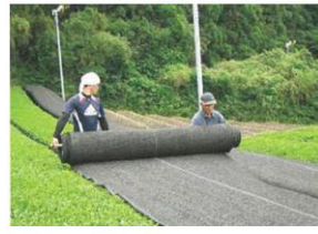
茶の被覆作業の実施