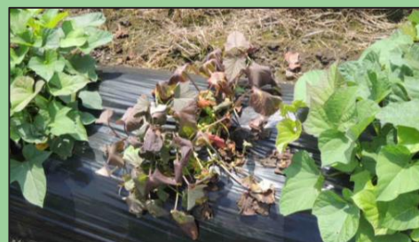
本ぽ生育初期の異常株