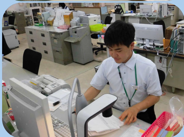
新採用職員の業務風景