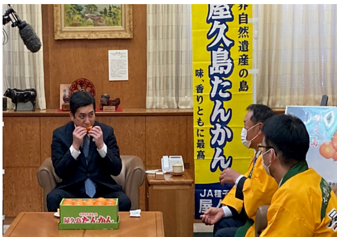
△鹿兒島県知事 塩田康一氏訪問

JA管内の約8割を占める鹿兒島ブランド「屋久島たんかん」は、生育前半は天候不順や9月に被害を受けた大型台風の影響もありましたが、生育後半は安定した天候と生産者の努力により大変質の高いたんかんとなりました。生産農家170戸で