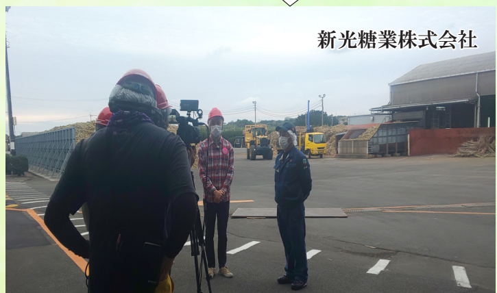
新光糖業株式会社