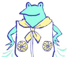
ファン付きウェア、 ネッククーラー