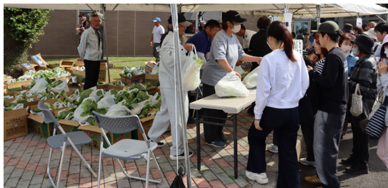
▲▼長〜い行列に大忙し！