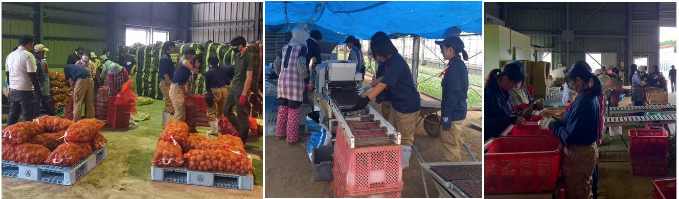
▲真面目で一生懸命！職場体験の間頑張ってもらいました！

西之表営農販売課の石堂集荷場で10月20日から24日まで、種子島高等学校生物生産科の生徒17名が職場体験学習を行いました。ばれいしょの種子の詰め替え作業や育苗ハウスでのブロッコリーの種子播き作業、青果用さつまいもの出荷作業を体験しました。