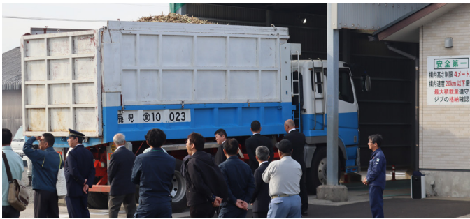
▲▼運び込まれるサトウキビ