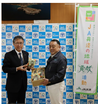
▲左：西之表市八坂市長 右：宮脇組合長