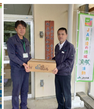
▲左：中種子町学校給食センター浦邊所長 右：塩屋部長