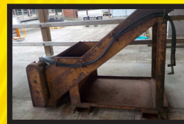
ボールクラッシャー①