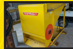
ボールクラッシャー②

開催日時：令和8年2月下旬開催予定 (詳細な日時は決定次第掲載致します) 開催場所：種子島地区 Aコープ中種子店前駐車場