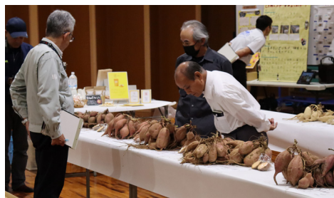
▲入念な審査中・・・