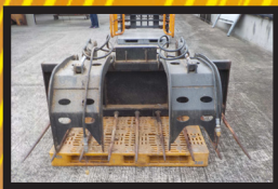
スーパーグラップルフォーク