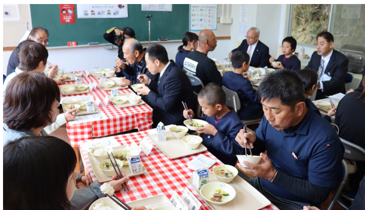
▲美味しい給食に箸が止まらないですね！

3月10日、南種子町の花峰小学校で、4年生から6年生の児童ら9名と多くの来賓が参加し、黒毛和牛を使用した給食の試食会が開かれました。